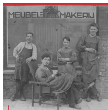
6 MEUBELWERKPLAATS RIETVELD GERRIT RIETVELD IN STOEL

Toen het bouwverbod op de polder tegenover het Rietveld Schröderhuis werd opgeheven, kocht Truus Schröder de grond ertegenover. Zo kon zij haar nieuwe uitzicht zelf bepalen. Rietveld ontwierp daarvoor een rij met vier huizen (1931) en een blok met zes appartementen (1934) in de stijl van Het Nieuwe Bouwen. Het ontwerp voorzag in ruime lichtinval en optimaal contact met de buitenlucht. Daarom hebben de huizen brede doorlopende raamstroken, balkons op de verdiepingen en heeft elke kamer een deur naar buiten. In oktober 1931 werd één van de woningen opengesteld om een modelinterieur van Rietveld te tonen. Dat is nu zichtbaar in de modelwoning. Opvallend is het kleurgebruik. De bakstenen gevels zijn wit gepleisterd. Binnen gebruikte Rietveld pastelkleuren. Daarvoor bleef hij ook in de latere interieurs die hij ontwierp voorkeur houden.