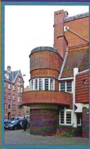
Michel de Klerk (1884 - 1923), detail Het Schip, Amsterdam, 1921 .

Uitgebreide informatie over onze activiteiten is te vinden op onze website: www.vvnk.nl