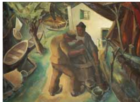
Mommie Schwarz, Vissers te Breukelerveen , 1930, bruikleen Stedelijk Museum.

Met '1993' blikt Kranenburgh terug op zijn allereerste tentoonstelling in (toen nog) villa Kranenburgh. In april 1993 opende Museum Kranenburgh zijn deuren. In villa Kranenburgh, nu bekend als de oudbouw, werd een overzicht gegeven van de spraakmakende kunstenaars van de Bergense school. In 2018 viert Kranenburgh zijn 25-jarig bestaan met een heropstelling van deze eerste tentoonstelling.