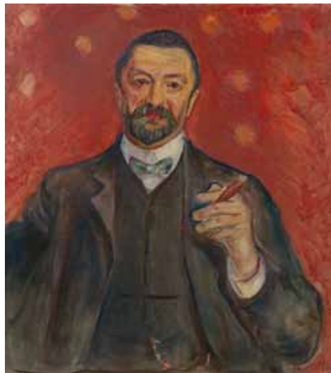
Edvard Munch, Portret van Felix Auerbach, 1906, Van Gogh Museum, Amsterdam.

Het Van Gogh Museum heeft zijn collectie verrijkt met een schilderij van Edvard Munch (1863-1944): het portret van de Duitse natuurwetenschapper Felix Auerbach (1906). Felix Auerbach is te zien in de vaste collectie van het museum op de derde verdieping, waar het in een speciaal daartoe ingerichte presentatie tussen andere portretten van Van Gogh en moderne kunstenaars als Kees van Dongen en Jan Sluijters hangt. Het werk van Van Gogh dat – door de achtergrond – het meest op dat van Munch lijkt, is Portret van Eugène Boch (De Dichter) uit 1888. Dat hangt daar niet bij; het is te vinden in het Musée d'Orsay in Parijs. Daarom hier ter vergelijking een afbeelding.