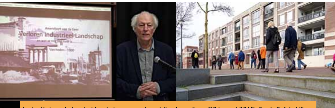
Lezing Verloren Industrieel Landschap en rondwandeling Amersfoort (27 januari 2018).

Inmiddels heeft een eerste overleg plaatsgevonden met de directie van het Drents Museum over de gang van zaken rond de schenking van de SSK. Het gesprek verliep in een prima sfeer. Het museum is voornemens de vaste collecties, waaronder dus die waarvan de SSK-schenking deel uitmaakt, op een andere manier te gaan presenteren. Tijdens de komende Algemene Ledenvergadering zal een nadere toelichting worden gegeven.