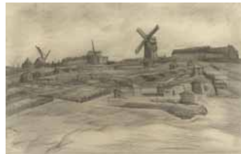
Vincent van Gogh, De heuvel van Montmartre, 1886, Van Gogh Museum, Amsterdam.

Ook te zien: Impressionism & Beyond. A Wonderful Journey;