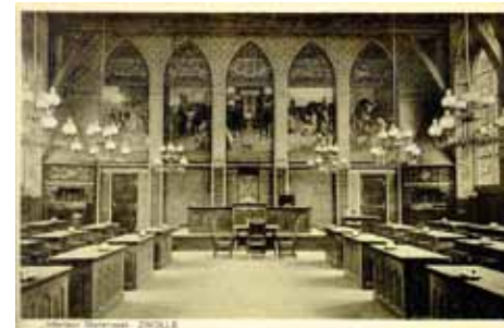
VONK Nieuwsbrief 2018 nr 1 pagina 3