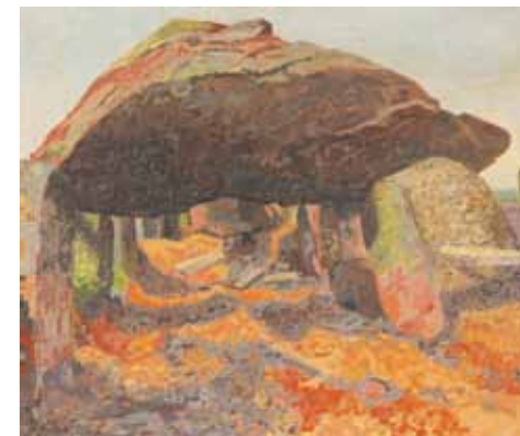
Afb. 3. Johan Briedé, Hunebed bij Eext , 1927, olieverf op doek, Drents Museum, Assen.

Hij was een van de weinige schilders die in die veengebieden, de 'donkere kant' van Drenthe, verbleven heeft. Het maakte diepe indruk op hem. Hij vertrok na bijna drie maanden, uit eenzaamheid en geldgebrek. Zijn Drentse periode leverde Van Gogh 40 tekeningen en schilderijen op. Zeven ervan zijn in het boek opgenomen. Het Drents Museum heeft zijn schilderij 'De Turfschuit' in de collectie. Het is aangekocht met onder andere de steun van de Stichting Schone Kunsten rond 1900 [Afb. 2].