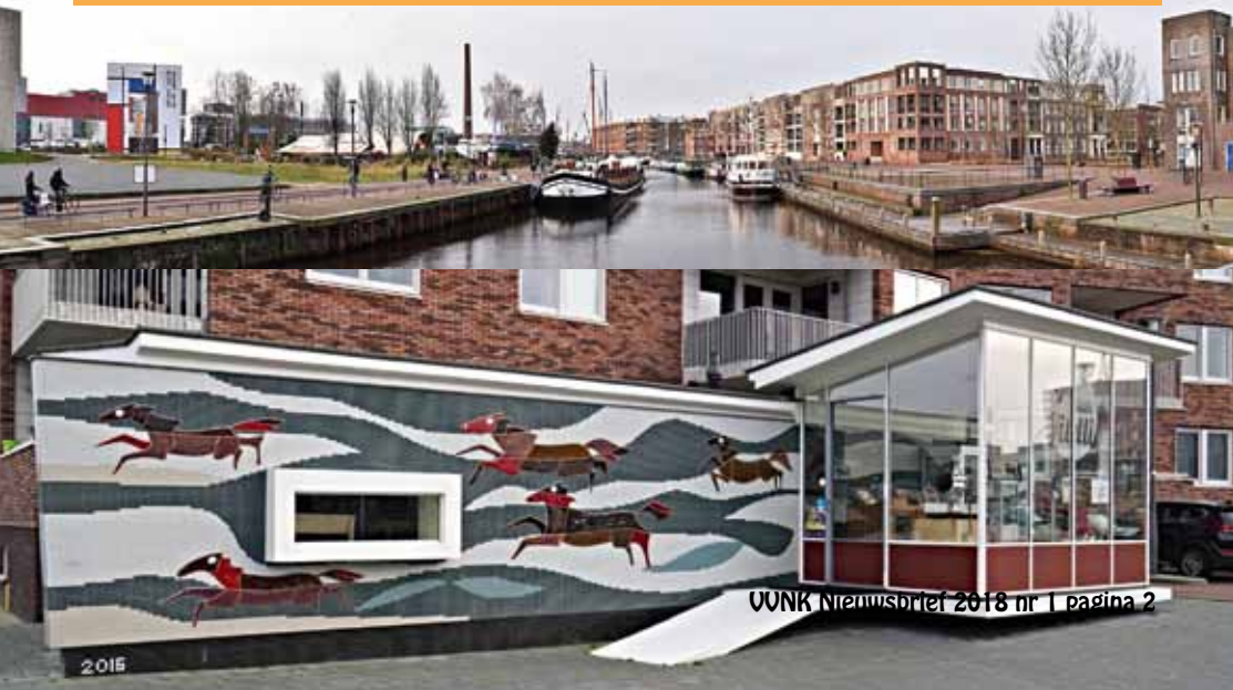
VONK Nieuwsbrief 2018 nr 1 pagina 2