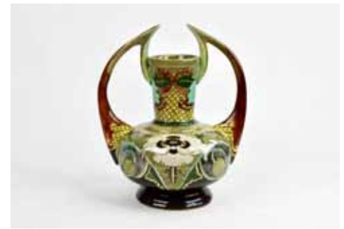
Amfoor, Brantjes, 1903.