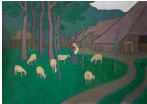
Simon Moulijn, Landschap met boerderij in Drenthe, 1894, Drents Museum, Assen.

Het Drents Museum heeft op de tentoonstelling die onlangs is gehouden uit de nalatenschap van Simon Moulijn (1866-1948) een schilderij van deze kunstenaar aangekocht. Het werk, een olieverfschilderij Landschap met boerderij in Drenthe (1894) stamt uit de symbolistische periode van Moulijn, en is een mooie aanvulling op de kunstwerken die het museum al in bezit had van deze kunstenaar.