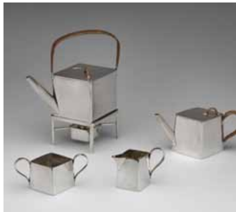
Theeservies ontworpen door Christopher Dresser, 1894-1901.