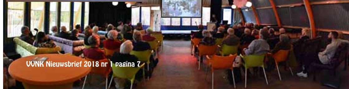
Fotoimpressie uitreiking VVNK-scriptieprijs en -lezingen.