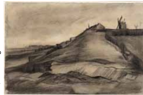
Vincent van Gogh, De heuvel van Montmartre, 1886, Van Vliissingen Art Foundation.