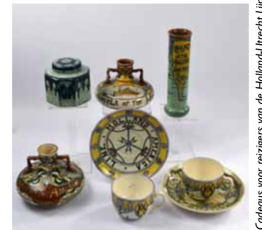
Codeaus voor reizigers van de Holland-Utrecht Lijn, ca. 1906.

N.B. In het Veenkoloniaal Museum in Veendam ( www.veenkoloniaalmuseum.nl ), loopt parallel hiermee van 27 mei tot 7 oktober de expositie 'Veendam in de Vaart'. Deze tentoonstelling brengt het verhaal over vijf schepen met de naam Veendam, waarvan vier schepen van de Holland America Line.