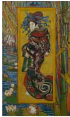
Vincent van Gogh, Japanees courtesane , 1887, van Gogh Museum, Amsterdam.

schilderde Van Gogh de voorstellingen na. Zo creëerde hij zijn eigen beeld van Japan - hij heeft het land nooit bezocht. De tentoonstelling ontrafelt hoe Van Gogh de Japanse voorbeelden steeds naar zijn eigen hand zette en hoe dit zijn werk ingrijpend veranderde.