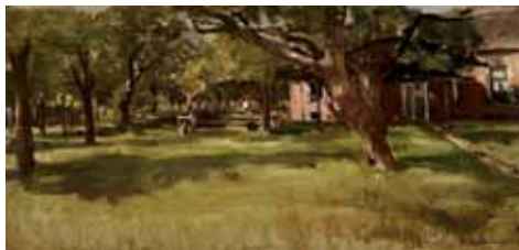
Max Liebermann, Bleekveld te Zweeloo, 1882, olieverf op papier op paneel, collectie Drents Museum.

De kosten voor deze excursie bedragen € 22 voor leden en € 28 voor introducees. Jongeren t/m 26 jaar betalen € 11.