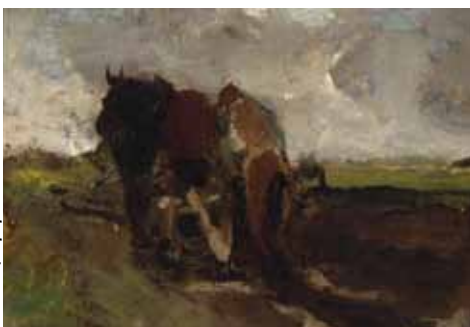
G.H. Breitner, Ploegende boer in Drenthe, 1885, olieverf op paneel, collectie Drents Museum.

Tenslotte: op dit moment is nog niet te overzien hoeveel deelnemers zich aanmelden en hoeveel studenten zich zullen presenteren. De definitieve volgorde van de lezingen en presentaties is daarom nog niet bepaald.