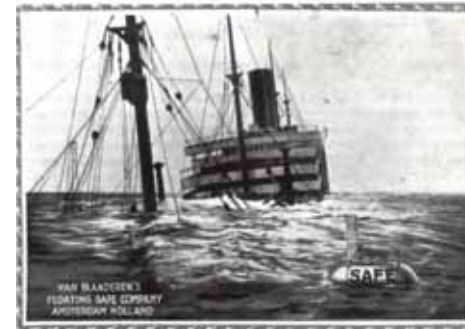
Advertentie van de N.V. Maatschappij tot exploitatie van Van Blaaderen's Drijvende Brandkasten, 1919.

De drijvende brandkast was een project van Cornelis van Blaaderen (1875-1933) in de tijd dat het vervoer over zee als gevolg van de Eerste Wereldoorlog regelmatig averij opliep. De brandkast kon op schepen worden bevestigd op een wijze waarop van Blaaderen in een aantal landen octrooi had gekregen. 2