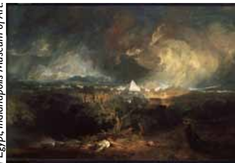
J.W.M. Turner, The Fifth Plague of Egypt, Indianapolis, Museum of Art

door ultieme schoonheid, maar ook door dreiging en gevaar. Turner wilde sublieme sensaties beleven door zich te onderwerpen aan barre tochten op zee of door het bezoeken van verlaten ruïnes en overweldigende watervallen. Hij bestudeerde in zijn schilderijen en aquarellen intensief de elementen Aarde, Lucht, Water en Vuur. Want voor Turner waren deze vier natuurkrachten de sleutel tot de weergave van een persoonlijk gevoelde, sublieme ervaring.