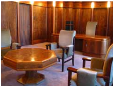
Interieur Paleis Raadhuis