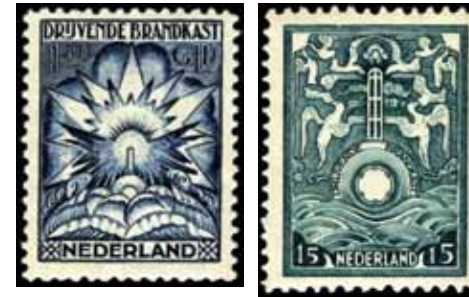
Ontwerp frankeerzegel Leo Gestel (links) en Carel Lion Cachet (rechts), 1919.

vaart gemiddeld slechts 7 à 8 brieven mee. Nog geen drie jaar na de lancering werd de verkoop van zegels per 1 september 1923 gestaakt en kon er geen gebruik meer worden gemaakt van de brandkastzegels. Wie nog zegels had kon deze tegen contant geld inruilen op het postkantoor. Daarna werden deze zegels voor filatelisten zeer waardevol en streed Cornelis van Blaaderen een lange maar tevergeefse strijd om de zegels te verkrijgen en tegen een aantrekkelijk bedrag aan filatelisten te verkopen. Hij zou zelfs op 31 augustus 1923 aan het loket van het postkantoor in Bussum voor fl. 200.000 brandkastzegels hebben willen kopen. Als de koop doorgestaan zou zijn, dan had Van Blaaderen de zegels tot 31 oktober tegen de nominale waarde weer mogen inleveren en had hij als mede-uitgever van de zegels 5/8 van de waarde kunnen ontvangen. 8 Uiteindelijk werden de activiteiten van het bedrijf gestaakt en de onderneming in 1932 geliquideerd. 9 De uitvinder van de drijvende