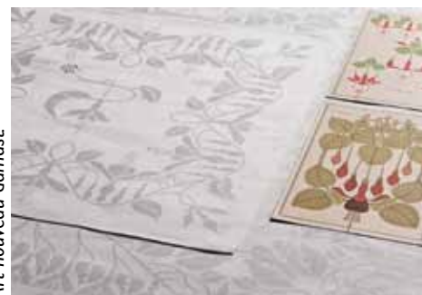
Art nouveau damast

In de gebouwen is onder meer te zien een historische encensering van een Wollendekenfabriek uit 1900-1940, een geres-taureerde machinekamer met stoommachine, oude weefgetouwen etc. en ook een aantal mooie exposities en een prachtige