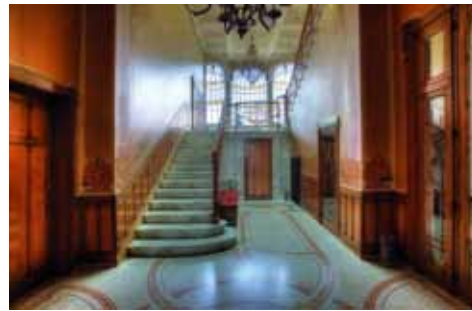
Max Hallet huis.

Louizalaan, 224, 1050 Brussel, beide ontworpen door Victor Horta.) Het Hallet huis was opgenomen in het VVNK excursieprogramma 2014. Voor degenen die niet meegegaan zijn in 2014 is er dus een herkansing.