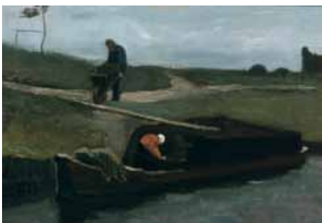
Vincent van Gogh, De Turfschuit, 1883, olieverf op doek, collectie Drents Museum

Roelofs, H.W. Mesdag en Julius van de Sande Bakhuyzen, Tachtiger G.H. Breitner en de Duitse Max Liebermann schilderen er. De modderige verbindingswegen en het gebrek aan moderne voorzieningen nemen ze op de koop toe, want Drenthe is in hun ogen nog mooier en onbedorvenner dan Barbizon. In de kunstwereld wordt 'Drentsch' een handelsmerk dat staat voor een oeroud landschap met uitgestrekte heidevelden, mysterieuze hunebedden en schilderachtige dorpen. Het Drents Museum toont in deze tentoonstelling de mooiste Drentse landschappen uit zijn eigen collectie.