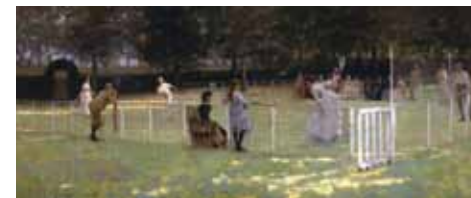
John Lavery, The tennis party , olie op doek, 1885. Aberdeen Art Gallery & Museums Collections, Aberdeen

en Frankrijk te schilderen. In Parijse ateliers volgden ze opleidingen en ze reisden zelfs naar Japan. De kracht van The Glasgow Boys was dat zij zich niet alleen allerlei invloeden eigen maakten, maar ook dat zij die verwerkten tot fris en vernieuwend werk.