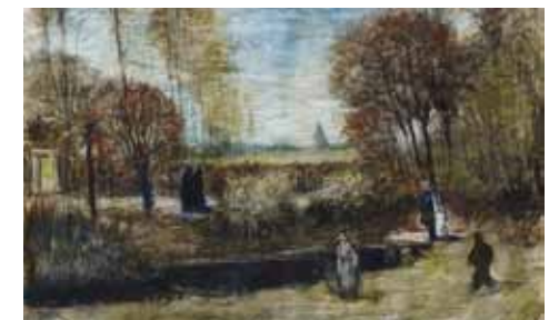
Vincent van Gogh, De Pastorie in Rijswijk, 1885, particuliere collectie.

Vincent van Gogh voelde een grote liefde voor het Brabantse land. Hij woonde en werkte er het grootste deel van zijn leven. Het Noordbrabants Museum is de enige plek in Brabant waar men zijn schilderijen kan bekijken. Ter gelegenheid van Van Gogh 2015 worden in Vincent van Gogh - Rondom de pastorie de schilderijen uit de vaste Van Goghpresentatie in een