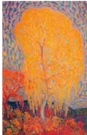
Herfstboom, circa 1910, particuliere collectie.