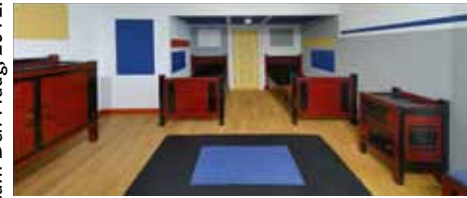
Jongensslaapkamer, villa De Arendshoeve, Voorburg reconstructie Gemeentemuseum Den Haag, 2012.

liebezit afkomstig en nog steeds in gebruik. Bijzonder zijn enkele reconstructies, zoals Klaarhamers woonkamer op het Oudkerkhof 48bis in Utrecht, en een deel van zomerhuisje De Kluis in Blaricum.