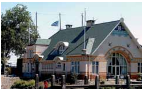
Ex- en interieur De Maas