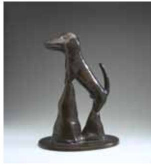
Joost van den Toorn, Triumph des Willens , 2001.

Op 1 mei 1902 wordt de Renkumse Kunstvereniging Pictura Veluvensis opgericht. Men wil de belangstelling voor de beeldende kunst in de regio bevorderen en de samenwerking tussen de in Renkum en Heesum wonende kunstenaars versterken, bijv. door het organiseren van zomertentoonstellingen en het samenstellen van winterportefeuilles met aquarellen, tekeningen en grafiek, die circuleren langs