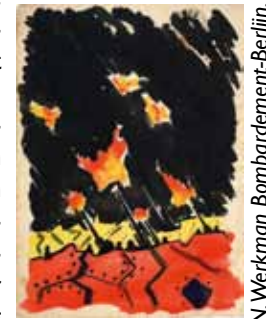
H.N. Werkman Bombardement-Berlijn .

Ook kleinzoon Arne Werkman heeft de creativiteit in zijn genen, hoewel die zich uit in een andere discipline: de muziek. Zijn composities worden veelvuldig uitgevoerd in het binnen- en buitenland door vooraanstaande musici. In het auditorium van Museum Dr8888 zullen gedurende de tentoonstellingsperiode verschillende composities van Arne Werkman uitgevoerd worden.