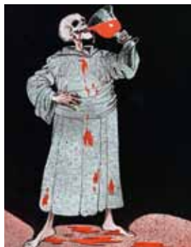
Louis Raemaekers, To your health, civilization , 1916.

het leed van gewone mensen. De zinloosheid van de oorlog wordt altijd geschreven met het bloed van weerloze burgers, de krijgsheren blijven op de achtergrond. Door zijn tekeningen