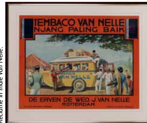
Reclame in Indië van Nelle.

De tentoonstelling schetst aan de hand van een rijke verzameling affiches, advertenties en reclameplaten de geschiedenis van de reclame in Nederlands-Indië tot de Tweede Wereldoorlog begon. Het laat zien hoe de kolonie in de eerste decennia van de twintigste eeuw moderniseert en er zich een volwassen reclamebranche ontwikkelt die niet veel onderdoet voor die in het moederland. Reclame duikt overal op: pro-