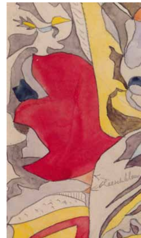
Colenbrander, ontwerp met groep tulpen met kleuraanwijzing in potlood.

Arno Weltens was onder andere binnenhuisarchitect en tentoonstellingsvormgever. Met de biografie over Theo Colenbrander rondt hij een studie af van meer dan veertig jaar.