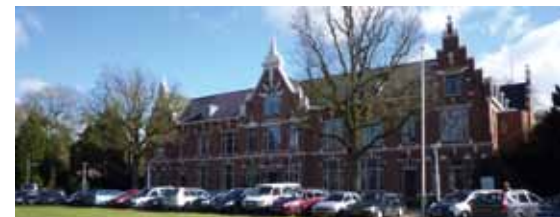
Hoofdgebouw 2 (boven) en Watertoren (onder).

gelegde terrein van Dennenoord bevinden zich nog verschillende gebouwen uit de begintijd en uit de jaren dertig van de 20ste eeuw. Het momenteel als hoofdkantoor fungerende hoofdgebouw kwam in 1895 tot stand naar een ontwerp in neorenaissance-stijl van K. Hoekzema.