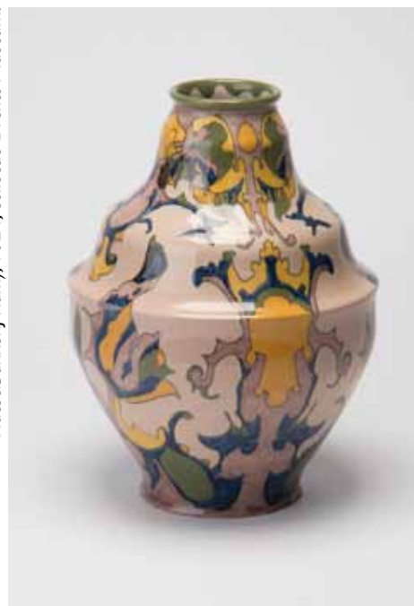
Theo Colenbrander, vaas, decor 'Open werk' (uitvoering Plateelbakkerij Ram), 1924, collectie Drents Museum.

Minder bekend zijn Colenbranders verrichtingen als binnenhuisarchitect en grafisch ontwerper. Met de producten van de plateelbakkerij RAM bereikte Colenbrander artistiek gezien een nieuw hoogtepunt in zijn loopbaan. Hij blijkt dé grote vernieuwer op het gebied van de Nederlandse toegepaste kunst. In deze begeleidende monografie wordt zijn leven en werk beschreven bij plateelbakkerij Rozenburg (Den Haag), interieurs voor de familie Mesdag, als boekvormgever en tapijontwerper in de Amersfoortse en Deventer Tapijtfabrieken, de plateelbakkerij Zuid-Holland (Gouda) en tenslotte Ram. Daarna volgt een kunsthistorische beschouwing over Colenbranders inspiratiebronnen in de natuur en oosterse kunst evenals zijn eigenzinnige, kleurrijke en vaak grillige ontwerpen. Decornamen en dessins van Rozenburg, Deventer, Zuid-Holland en Ram zijn in de bijlagen te vinden,