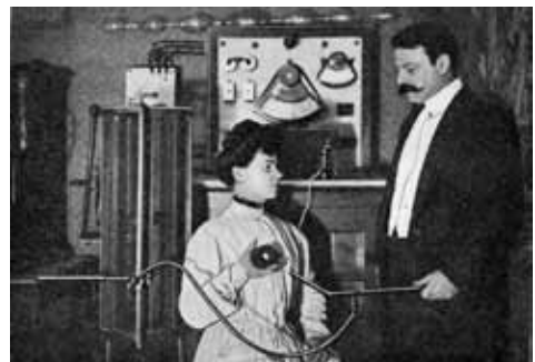
2 afbeeldingen medische elektriciteit.

In de 19de eeuw krijgt de elektrotherapie geleidelijk vaste voet aan de grond in de geneeskunde, met eigen handboeken en afdelingen in ziekenhuizen. Het wordt een specialisme dat breed wordt ingezet, met name ook tegen tumoren en pijn; aan het