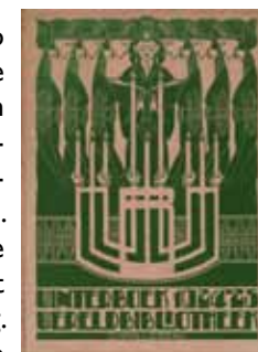
Boekomslag Chris Lebeau.