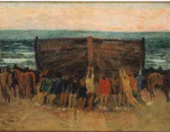
J. Toorop, Bomschuit op het strand te Katwijk .

stenaar die Katwijk bezocht was Hans von Bartels (1856-1913) uit München, die erg onder de indruk was van het vissersleven. Het Museum Katwijk heeft veel werk van hem in bezit. Ook fotografen bezochten rond 1900 Katwijk, zoals de Amerikaan Alfred Stieglitz (1864-1946). Jan Toorop (1858-1928) is ongetwijfeld de belangrijkste kunstenaar die Katwijk heeft bezocht en daar ook een woning met de naam 'De Schuur' naar een ontwerp van H.P. Berlage heeft laten bouwen. Op de tentoonstel-