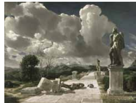
Carel Willink, Landschap met omgevallen beeld (1942) .

breder artistieke stroming in binnen- en buitenland, die breder was dan alleen de schilderkunst. Schrijvers en componisten schiepen verwante werelden en, zoals Kasteel Heeswijk nu laat zien, ook tuinontwerpers bewogen zich in dezelfde artistieke context.