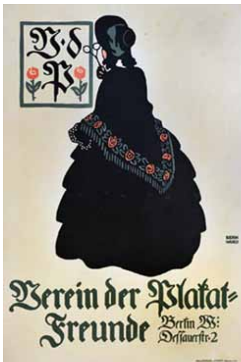
Lucian Bernhard (1883-1972), affiche.