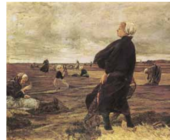
M. Liebermann, Netzflickerinnen.