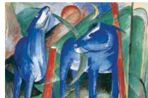
Franz Marc, De schepping van de paarden .

Zwolle - Museum de Fundatie 0572-388188 / www.museumdefundatie.nl