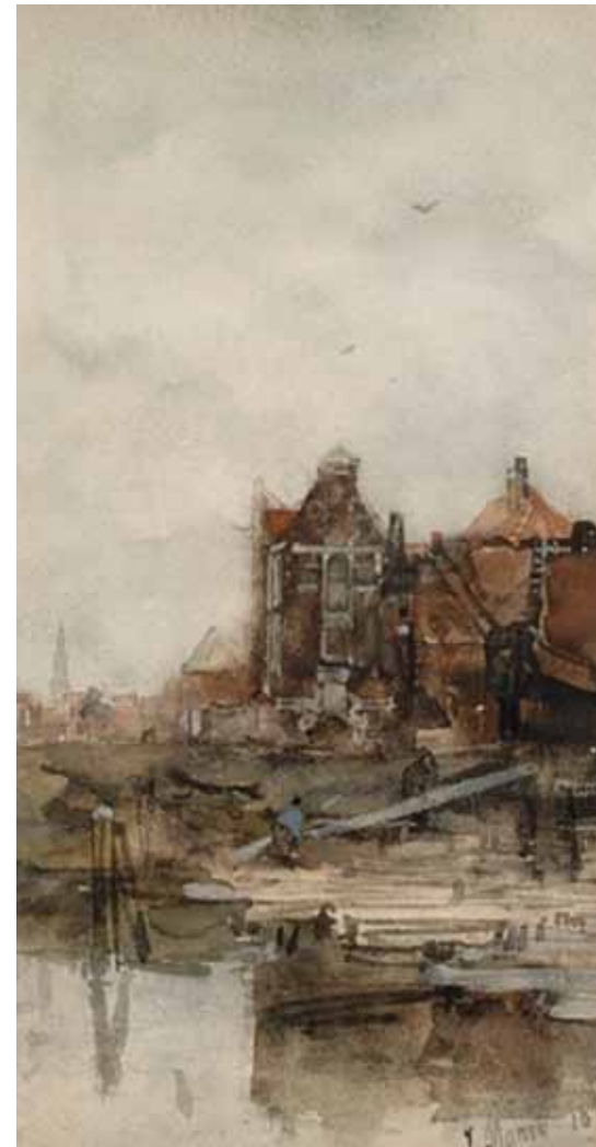
Afb. 4 Een van de (vroeg) stadsgezichten van Jacob Maris, 1877, aquarel. Privécollectie.