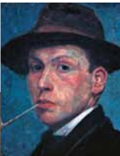
Zelfportret Piet Wiegman, ca. 1911. Particuliere collectie.