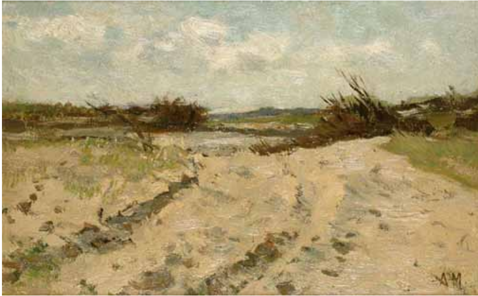
Afb. 5 Anton Mauve (1838-1888), Duinlandschap , olieverfschets. Privécollectie.

dacht hij terug aan de intensieve sessies met Mauve, bijvoorbeeld over de manier waarop je het perspectief van de aardkluiten in duingrond kon weergeven. (afb. 5)