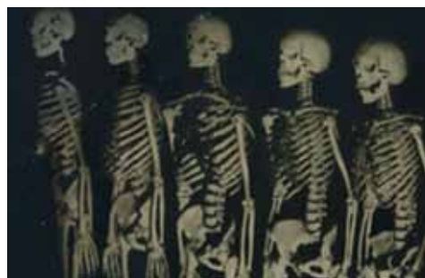
John Heartfield, Vater und Sohn (detail), 1924, foto, Collectie Akademie der Künste, Berlin, VG Bildkunst Bonn (afbeelding met de geraamtes).