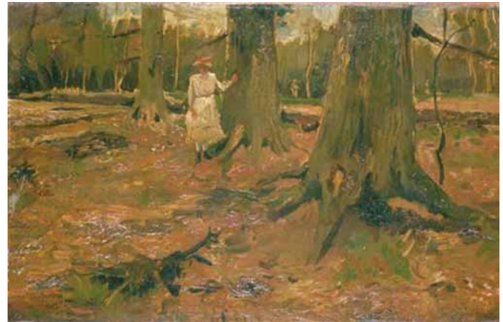
Afb. 6 Vincent van Gogh, 1882 Meisje in een bos . Kröller-Müller museum, Otterlo.

Maar helaas, na een paar weken was hij toch niet meer zo tevreden. "Er gaat dan ook niet dan hoogst zelden een dag voorbij waarop ik 't een of het ander maak maar het is nog niet het eigentlijke wat ik wil". Het lijkt weer te gaan om de weergave van de menselijke figuur. "Er is een algemeene