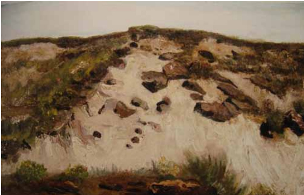
Afb. 7 Vincent van Gogh, 1882, Duinen. Privécollectie.

kennis van 't figuur voor nodig die ik mij tracht eigen te maken door het teekenen van grote figuurstudies".