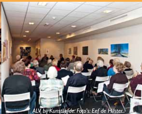
ALV, bij Kunstliefde.