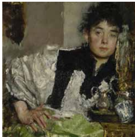
Antonio Mancini, (1852-1930), In gedachten verzonken (detail), ca. 1895-1898, olieverf op doek. De Mesdag Collectie Den Haag.

Hendrik Weissenbruch en de gebroeders Jacob, Willem en Matthijs Maris. Mesdag was niet alleen geïnteresseerd in de School van Barbizon en de Haagse School. De collectie bevat ook werk van kunstenaars als Marius Bauer, Gustave Courbet en Antonio Mancini.