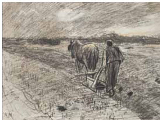
Afb. 1 Ploeger, houtskooltekening van Anton Mauve. Privécollectie.

Na een kunstarme periode als hulprediker bij de mijnwerkers in de Boringe schrijft hij in een brief aan zijn broer Theo dat hij weer verlangt naar het "land van de schilderkunst". Daarbij noemt hij Rembrandt, Millet, Dupré, Delacroix, Millais en de dromerige Matthijs Maris. Hij