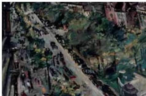
Lovis Corinth, Unter den Linden (detail), 1922, Collectie Von der Heydt-Museum Wuppertal.

Ter gelegenheid van de opening zijn er drie speciale tentoonstellingen waarvan DANS OP DE VULKAAN – KUNST EN LEVEN IN DE REPUBLIEK VAN WEIMAR 1918-1933 voor ons van belang is. Deze periode geldt als een hoogtepunt van kunst en cultuur in Duitsland maar was ook een tijd van felle politieke strijd en economisch verval. Topstukken worden getoond van Duitse kunstenaars zoals Käthe Kollwitz, Lovis Corinth, Max Beckmann, Otto Dix,