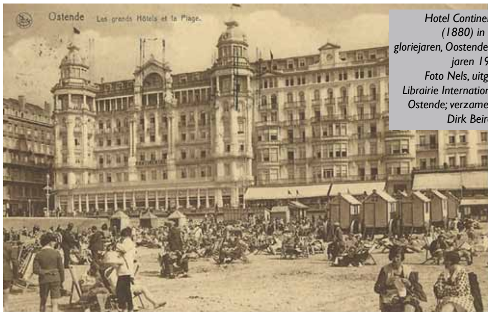
Hotel Continental (1880) in zijn gloriejaren, Ostende, de jaren 1920.

Opmerking: na elke lezing is er gelegenheid om vragen te stellen.