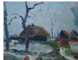
Afb. 6. Gerhard Willem, wintergezicht.