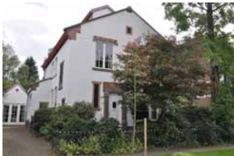
Het huis de Zeeuwse knoop, Tutein Noltheniuslaan 14, Apeldoorn.

Pieter Puype leerde van zijn vader het ambacht van het houtsnijden en hoewel Apeldoorn zijn tweede thuis werd, bleef hij geïnspireerd door de motieven van de Zeeuwse volkskunst zoals hij ze ook toepaste in zijn houtsnijwerk. In de decoratie van zijn woonhuis en atelier De Zeeuwsche