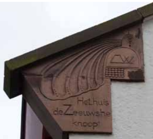
Detail van de Zeeuwse Knoop

Knoop aan de Tutein Noltheniuslaan nr. 14 voeren Zeeuwse motieven dan ook de boventoon. Dit unieke en bijzondere woonhuis is op verrassende wijze in de tentoonstelling aanwezig in de vorm van Puypes huisraad.