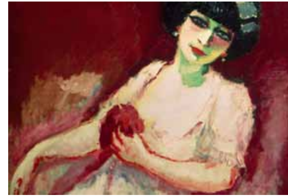
Kees van Dongen, Femme rose sur fond rouge, olieverf op doek, 81 x 100 cm.

Liefhebbers van kunst rond 1900 kunnen in het voorjaar van 2013 hun hart ophalen. In de intieme setting van het Willem Cordia kabinet worden zo'n 25 pareltjes uit die periode getoond. Van Kustlandschap in