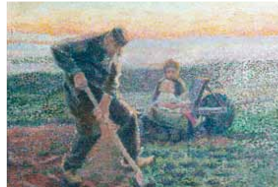
Jan Toorop, Spittende boer, olieverf op doek, 66 x 75 cm.