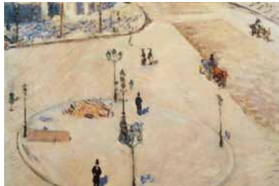
Boulevard Haussmann, 1880.

Daarnaast vervulde hij als mecenas een belangrijke rol in het succes van het impressionisme. Hij ondersteunde vrienden als Claude Monet en Auguste Renoir financieel door werk van hen aan te kopen en tentoonstellingen te organiseren. In landen als Frankrijk, Engeland en de Verenigde Staten heeft Caillebotte inmiddels niet alleen als mecenas maar ook als kunstenaar een welverdiende plaats in de kunstgeschiedenis ingenomen. Het Gemeentemuseum Den Haag toont in het voorjaar van 2013 het eerste overzicht van deze grootse kunstenaar in Nederland waarbij de nadruk ligt op de wisselwerking van zijn schilderkunst en de opkomende fotografie.