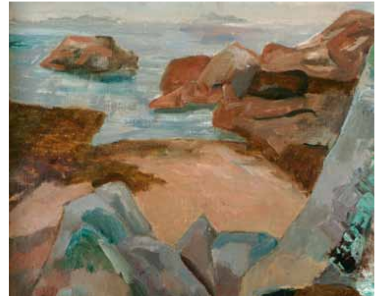
Conrad Kickert, Le rocher gris , 1913, olieverf op doek, 58.5 x 72 cm., Museum De Wieger, Deurne.

De reputatie van Voor de Kunst als een revolutionaire onderneming is dus enigszins overtrokken. Zowel met betrekking tot haar steun van de werkende klasse als haar aanbod van moderne kunst ligt genuanceerder. De bovengenoemde exposities tonen echter aan dat haar belang evenmin onderschat mag worden. Dit vraagt dan ook om een even genuanceerd beeld van het culturele leven in de Domstad, waar meer te beleven was dan men vaak doet vermoeden. Gelijk aan de Haagse en Rotterdamse Kunstkring toonde de Utrechtse vereniging kunstenaars met een goede reputatie naast jonge nieuwlichters met vooruitstrevende ideeën, of zoals Wichmann kenschetste: