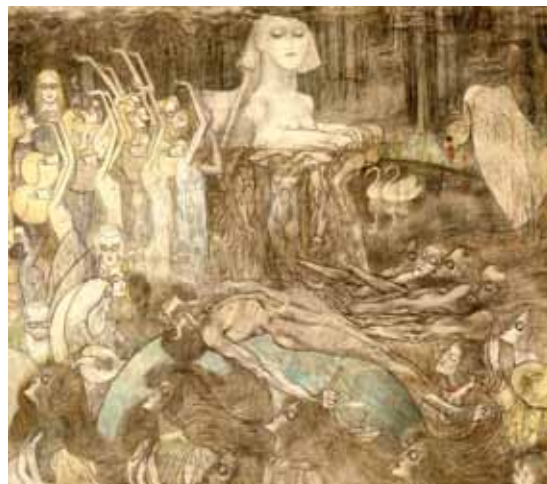
Jan Toorop, De Sphinx , 1892-1897, potlood en krijt op papier, 1260 x 1350 mm, Gemeentemuseum Den Haag.