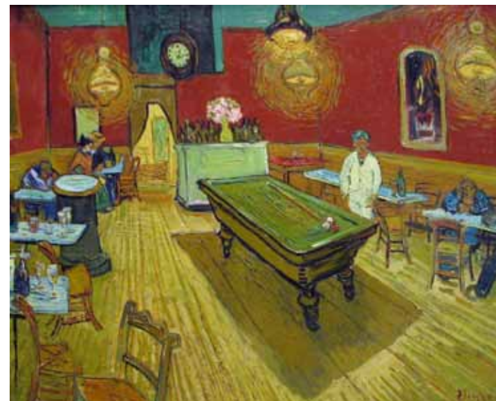
Vincent van Gogh, Café de nuit , 1888, olieverf op doek, 70 x 89 cm, Yale University Art Gallery, New Haven.

Hoewel Voor de Kunst zichzelf in 1907 feliciteerde met haar aanbod van het 'frische' en het 'nieuwe', bracht zij rond deze tijd nauwelijks werken van het nieuw opgekomen Luminisme, waarvoor liefhebber toch echt naar Amsterdam moesten afreizen. Desalniettemin zag men er genoeg