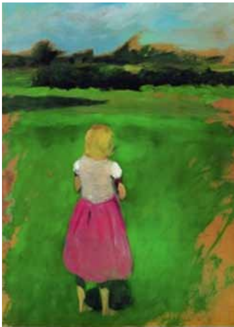
Hans am Ende, meisje in de wei .

In de zomer van 1889 kwamen zijn studievrienden Otto Modersohn en Hans am Ende met hem mee. Enkele jaren later legden zij met Fritz Overbeck en Heinrich Vogeler de basis voor de kunstenaarskolonie. Ze richtten de Künstlervereinigung Worpswede op en brachten hun werken in voor de Internationale Ausstellungen van 1895 en 1896 in het Glaspalast in München. Het werd een groot succes. Een toestroom van kunstenaars was het gevolg, tot ongenoegen van de oorspronkelijke kunstenaars. Een uitzondering maakten zij voor de jonge schilderes Paula Becker, de beeldhouwster Clara Westhoff en de dichter Rainer Maria Rilke.