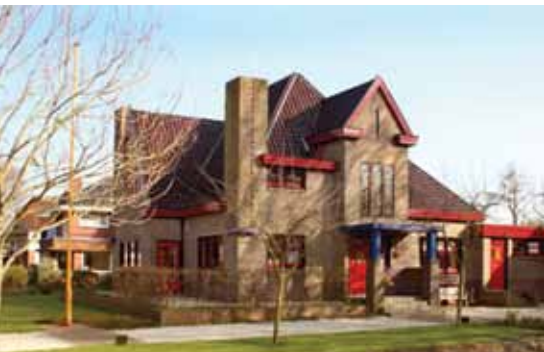
Rentenierswoning aan de Wadwerderweg.

samen met Titus Eliëns, de samensteller van de expositie Berlage Totaal!, de tentoonstelling in Usquert gerealiseerd. Centraal in de tentoonstelling staat uiteraard het fraai gerestaureerd raadhuis met zijn oorspronkelijke interieur. Daarnaast wordt aandacht besteed aan het oeuvre van Berlage in het Noorden en de interieurkunst uit de jaren waarin het raadhuis tot stand kwam.