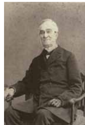
Links, van boven naar beneden:

Een belangrijke sleutel in het succes van de internationale verspreiding van de