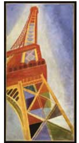
Robert Delaunay, La Tour Eiffel, 1926, olieverf op doek, 169 x 86 cm, Musée national d'art moderne, Centre Pompidou.

De Parijse sfeer breidt zich dit najaar ook uit over het naast het Gemeentemuseum gelegen Fotomuseum Den Haag. Eveneens vanaf 15 oktober zal hier de tentoonstelling Gare du Nord te zien zijn; met werk van Nederlandse fotografen die in de periode 1900-1968 in Parijs werkzaam zijn geweest.