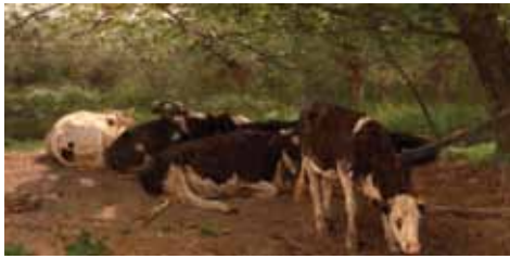
Anton Mauve, In de schaduw , 1874, doek, 89,5 x 179 cm, Collectie Museum Boijmans van Beuningen, Rotterdam. Goupil verkocht dit werk (inv.nr. 9416) aan het Museum Boijmans voor 2.400 gulden in 1876.