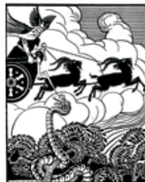
Thunar en de slang.

Apeldoorn – Coda museum 055-5268400 / www.coda-apeldoorn.nl/ Gust. van de Wall Perné; 5 november 2011 - 26 februari 2012 Kunstenaar Gust (Gustaaf) van de Wall Perné (Apeldoorn, 1877 – Amsterdam, 1911) stierf op 34-jarige leeftijd aan loodvergiftiging. Ondanks zijn vroege dood was hij binnen diverse disciplines zeer productief. Hij ontwierp niet alleen ex libris en boekbanden maar maakte ook illustraties,