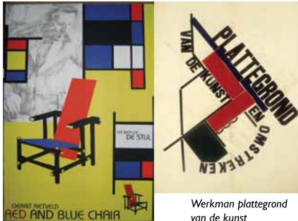
Werkman plattegrond van de kunst

De collectie De Ploeg vormt een van de hoogtepunten in de collectie van het Groninger Museum. Een aantal Groninger kunstenaars onder wie Jan Wiegers, Johan Dijkstra en Jan Altink nam in 1918 het initiatief tot de oprichting van deze kunstenaarskring. Er ontstond een schilderkunst die in hoge mate schatplichtig was aan het Duitse Expressionisme. Vooral de werken uit de jaren twintig en dertig van de vorige eeuw zijn