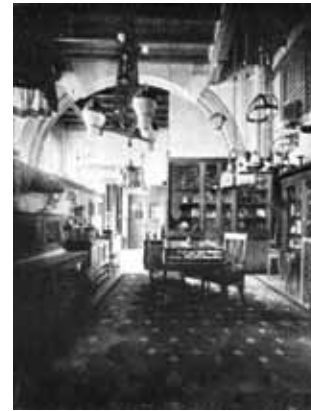
Interieur 't Binnenhuis in de Raadhuisstraat.

8 oktober 2011 t/m 4 maart 2012 In 1900 opende een van de eerste