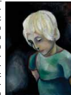
Charley Toorop, Klein meisje, 1920-1921.