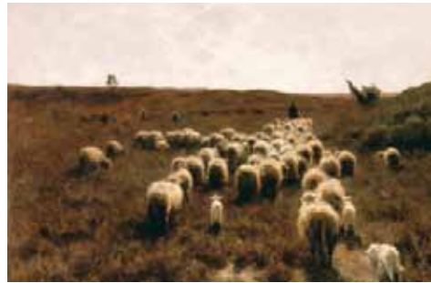
Anton Mauve, Return of the Flock , ca. 1885, doek, 100,2 x 161,3 cm, Collectie Philadelphia Museum of Art. Mauve verkocht dit schilderij aan Goupil in december 1885 (Goupil inv.nr. 17625). Goupil verkocht het vervolgens in 1889 voor 2.650 dollar in New York aan Dr. Wynkoop. Mauve won waarschijnlijk in 1887 op de Salon in Parijs een medaille voor dit werk.