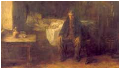
Jozef Israëls, Plus rien! , 1881, doek, 125 x 200 cm, Collectie Museum Mesdag, Den Haag. Hendrik Willem Mesdag kocht dit werk (inv.nr. 17789) in 1887 van Goupil voor 10.000 gulden voor zijn museum.