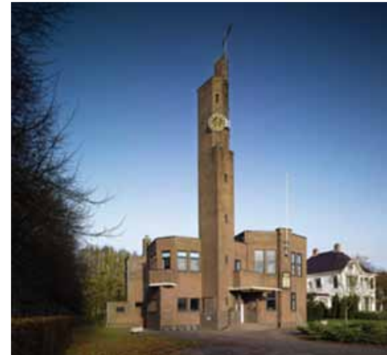
Raadhuis van Usquert.

Het in Groningen gelegen Usquert was rond 1900 een dorp met veel rijke inwoners. De door de tarwe rijk geworden herenboeren (men heeft het daar nog over de champagnejaren) lieten voor hun oude dag grote vrijstaande huizen in de Groningse dorpen waaronder Usquert bouwen en gingen daar met hun dienstbodes en ander personeel wonen. De kinderen konden dan het bedrijf verder voortzetten op de boerderijen. In Usquert heeft zelfs een filiaal van de Bank Mees en Hope gestaan om de herenboeren bij het beleggen van hun geld bij te staan! In Usquert is tot en met 30 oktober de tentoonstelling "Een raadhuis voor Usquert. Berlage in het Noorden" te zien. Het is de tweede tentoonstelling over Berlage in korte tijd. Eind 2010 was in het Gemeentemuseum Den Haag de groots opgezette expositie Berlage Totaal! te zien. Als vervolg hierop is in Usquert een tentoonstelling over Berlage in het Noorden georganiseerd. Het prachtige Raadhuis van Usquert behoort tot de late ontwerpen van Berlage. Het interieur met geglazuurde tegels, his-