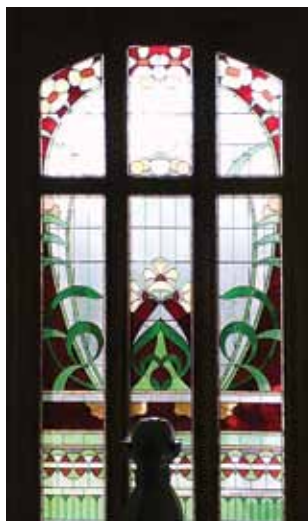
Glas-in-lood raam in trappenhuis villa Biwema.

quert om 12:06 uur. Overstappen in Groningen. Vanaf het station loopt u in 5 minuten naar het Raadhuis, herkenbaar aan de toren. De treinreizigers raden wij aan tijdens het overstappen in Groningen een kijkje te nemen in de bijzonder fraaie stationsrestaurantie.