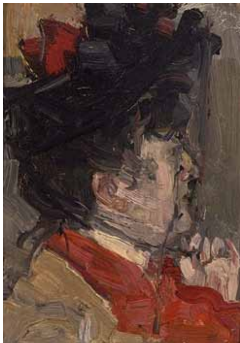
Isaac Israëls, Portret van Thérèse Schwartz en Profil, ca. 1900. Olieverf op paneel, 20 x 15 cm. Huidige verblijfplaats onbekend.

Dit latere 'rookvrije' portret van Thérèse Schwartz laat veel contrast zien en een vluchtige toets, die hij gebruikte in veel van zijn vriendinnenportretten, zoals bij-