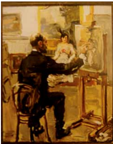
Isaac Israëls, Marius Bauer in Isaacs Atelier in Parijs, 1921. Olieverf op doek, 71 x 53 cm. Particuliere collectie.