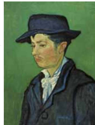
Vincent van Gogh. Portret van Armand Roulin (1888).

'Onzegbaar stralend en troostend', noemde Van Gogh de portretten die hij het beste vond. Zo had hij ze in de oude kunst leren kennen, en zo wilde hij ze zelf ook maken.