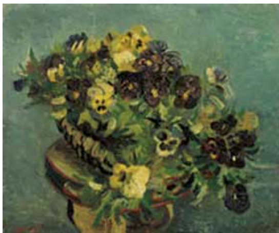
mand met viooltjes

Vincent van Gogh maakte regelmatig een schilderij op een doek waarop hij eerder al eens een voorstelling had geschilderd.