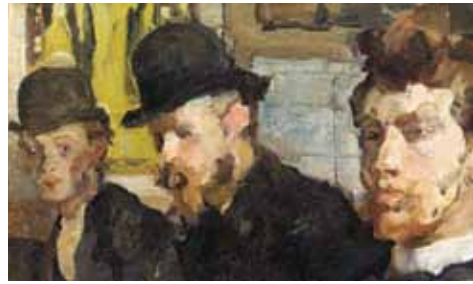
Isaac Israëls, Groepsportret vlnr Lion Cachet, Lodewijk van Deyszel, Theo Nieuwenhuis, 1894. Olieverf op paneel, 28,4 x 48 cm. Particuliere collectie (tot 2005).

De schilders van Tachtig, die de geestelijke opleving van de jaren tachtig in de negentiende eeuw, waarin verruiming centraal stond, tot uitdrukking lieten komen, bleken getalenteerde portrettisten. Jan Veth, George Breitner en Isaac Israëls zijn hier voorbeelden van; de mens boeide hen zeer en hun ingeboren zucht naar individualiteit als basis voor het kunstwerk gaf hun (zelf) portretten een nieuwe dimensie, hoewel dit op zeer uiteenlopende manieren gebeurde. Aan het begin van de twintigste eeuw bleef het portret een populair genre, hoewel de fotografie haar intrede al even had gedaan. De vraag naar transparantie en wetenschappelijke gelijkenis werd ingevuld door de fotografie, die een objectieve visuele relatie tussen het model en het beeld kon garanderen. In de vriendenportretten van Isaac Israëls komt de invloed van de fotografie naar voren. In inscenering zijn ze vaak vergelijkbaar met snapshots en close-ups, die destijds in trek waren bij zijn tijdgenoten George Breitner en Willem Witsen. Een voorbeeld hiervan is een vergelijking tussen de snapshot door Joseph Jessurun de Mesquita van