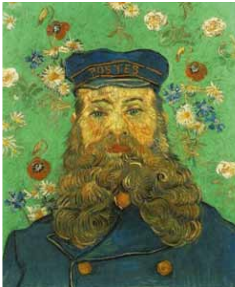
Vincent van Gogh (1853-1890). Portret van Joseph Roulin, februari-maart 1889. Olieverf op doek, 65x54. Collectie Kröller-Müller Museum, Otterlo.

jaren veertig tot de recentste periode. Uit het ensemble bijeengebrachte werken blijkt hoezeer hij zich op verschillende momenten heeft laten inspireren door het werk van Vincent van Gogh.