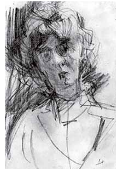
Isaac Israëls, Schets van een Vrouw, (vermoedelijk Thérèse Schwartz). Zwart krijt, 16,3 x 10,5 cm. Prentenkabinet Leiden.