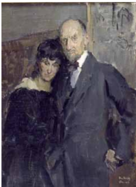
Isaac Israëls, Portret van Marius Bauer en zijn vrouw, 1 december 1918. Olieverf op doek, 69 x 51,5 cm. Museum of Art, Ein Harod, Israel (foto).

P.S. Dit model was het vriendinnetje van de Italiaanse gezant. Mijn man heeft haar twee keer geschilderd, ik meen een keer met rijkleren aan, hij gaf ze Isaac en zijn na diens dood op een veiling verkocht."