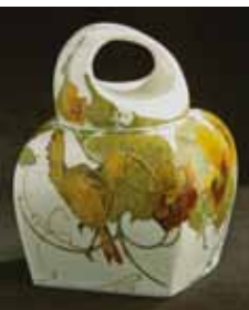
Fig. 9. Vaas, 1901, h 23 cm. Collectie Boymans Van Beuningen, Rotterdam.

geen technische noodzaak om het erop afgebeelde fantasieornament te stippelen. Andere voorbeelden met gestippelde ornamenten of vlakvulling treffen we aan op