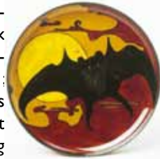
Fig. 4. Wandbord, 1901. STANYA collectie.

Bij een gebruikte compositie is het natuurlijk moeilijker om te beweren dat hiervoor afbeeldingen in het tijdschrift als voorbeeld hebben gediend, daar de gebruikte compositie net zo goed aan de eigen fantasie ontsproten kan zijn; wellicht ook na het bestuderen van allerlei afbeeldingen in het blad met soortgelijke composities. De compositie van de plaat met vogeltjes en bloesemtakken van Hokusai is vergelijkbaar met vele decors bij Rozenburg, met name bij het eierschaalporselein. De asymmetrie, de diagonale richting en de afwisseling tussen open en opgevulde vlakken zijn bij beide herkenbaar. Een goed voorbeeld hiervan is het decor van een vaasje uit 1914, waarop de plaatsing in het vlak van vogels