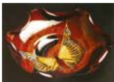
Fig. 8. Asbak, 1899, Ø 15 cm. Collectie Gemeente Museum Den Haag.

bare techniek is toegepast, zoals de plaat met de vlinders. Het is niet ondenkbaar dat de plateelschilders naar aanleiding van deze voorbeelden geïnspireerd zijn geraakt om de techniek toe passen of dat zij, door bestudering van deze voorbeelden, bevestigd werden in de juistheid van hun keuze voor deze techniek. Hoe dan ook was er voor de asbak uit 1899