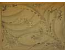
Fig. 7. Plaat DB, Le Japon artistique.

Als laatste in deze reeks vergelijkingen iets over de invulling van de vlakken op het keramiek met fijn arceerwerk of stippeltjes. In verschillende bronnen wordt gesuggereerd dat deze uitwerking geboren is uit technische noodzaak, daar de vlakken te groot zouden zijn om ze netjes egaal in te vullen. Dit is ongetwijfeld waar, maar toch vermoed ik dat deze techniek ook uit artistiek oogpunt is gebruikt. In Le Japon artistique vinden we enkele platen waarop een vergelijk-