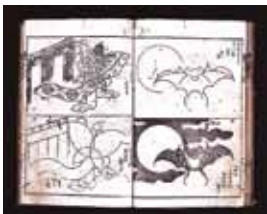
Fig. 3. Katsushika Hokusai, Quick Guide to Drawing , 1812

naar bleek te zijn. De illustratie in het tijdschrift is ook zeer verwant aan een vergelijkbaar wandbord uit 1901: deze vleermuis is alleen iets groter en de wolken zijn net iets anders vormgegeven. (fig 1-4) Ook andere dieren die als afbeelding in het tijdschrift voorkomen, zijn bij Rozenburg gebruikt als onderdeel van enkele decors. Zo zijn bijvoorbeeld de spin, al dan niet in combinatie met een spinweb, de kikker, de hagedis, de salamander, de schildpad, de haan en verschillende soorten vissen te zien op het sieraardewerk van Rozenburg.