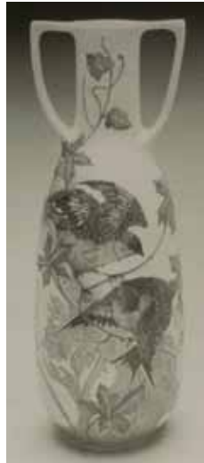
Fig. 5. Vaasje, 1914, h 16 cm. Particuliere collectie.