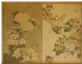
Fig. 6. Plaat CA, Le Japon artistique.

en planten vergelijkbaar is met Hokusai's compositie. (Fig 5-6)