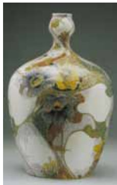
Fig. 10. Bonbonnière, 1904, h 12 cm. Collectie Proportio Divina, Arnhem.

In de bedrijfsbibliotheek waren nog 39 andere titels aanwezig; een aantal hiervan – bijvoorbeeld Fantaisies Décoratives (Parijs 1886-1887) en L'Art Japonais (Parijs 1883) – lijkt op min of meer dezelfde wijze gebruikt te zijn als Le Japon artistique , maar de hoeveelheid aangetroffen overeenkomsten tussen vormgeving, motiefkeuze en uitwerking van (een onderdeel van) de Rozenburgdecoraties en deze boeken is vele malen kleiner dan die