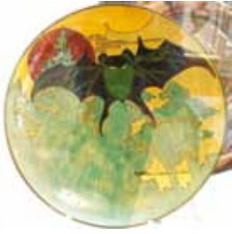
Fig. 1. Wandbord, 1899-1903. Particuliere collectie.

Wat betreft de gebruikte onderwerpen, kent de spaarzame literatuur een tweetal beschreven voorbeelden, namelijk het gebruik van de gouden regen en een zwemmende karper als decor voor enkele vazen en wandborden, die respectievelijk als een kleurenplaat in een omslag van Le Japon artistique voorkwamen. Minstens zo interessant is een wandbord of schotel waar ik tijdens mijn onderzoek op stuitte waarop we een decoratie van een vleermuis aantreffen, die regelrecht lijkt te zijn overgenomen van een illustratie in Le Japon artistique .