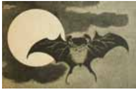
Fig. 2. Illustratie uit Le Japon artistique

Wat betreft de gebruikte onderwerpen, kent de spaarzame literatuur een tweetal beschreven voorbeelden, namelijk het gebruik van de gouden regen en een zwemmende karper als decor voor enkele vazen en wandborden, die respectievelijk als een kleurenplaat in een omslag van Le Japon artistique voorkwamen. Minstens zo interessant is een wandbord of schotel waar ik tijdens mijn onderzoek op stuitte waarop we een decoratie van een vleermuis aantreffen, die regelrecht lijkt te zijn overgenomen van een illustratie in Le Japon artistique .