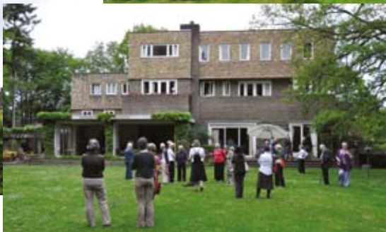
(boven) voormalig gymnasium en (rechts) villa 'De Wachter'