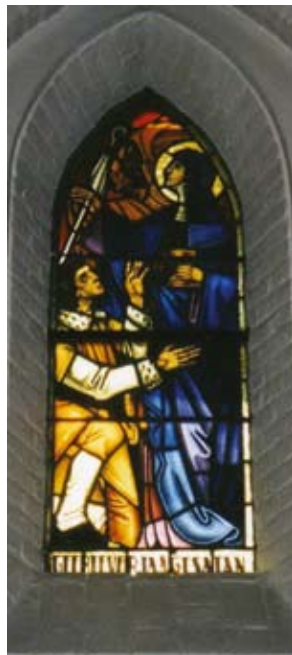
St.Geerten, Utrecht (1945)