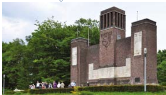
Belgenmonument van Huib Hoste

der Tak en in het huis en in de tuin van villa 'De Wachter' ontworpen door de architect Wijdeveld. ■