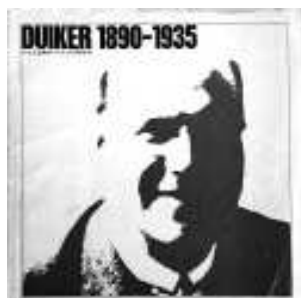
Overdruk van nrs 5 en 6, 22 e jg, januari 1972 van 'Forum voor architectuur en daarmee verbonden kunsten'.

Het is gebouwd in beton met ragfijne raam-