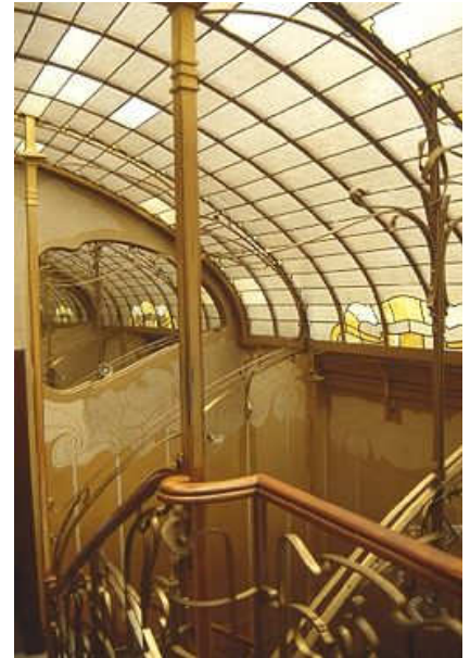
Interieur Horta Huis, Brussel

Tevens vindt een (zeer) korte 2 e ALV plaats over de statutenwijziging. Volgens de huidige statuten is namelijk in de praktijk een tweede vergadering nodig om deze door te voeren. Op basis van de nieuwe statuten is deze omslachtige procedure niet meer nodig.