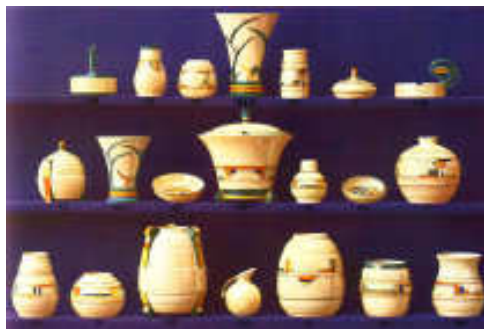
Uit catalogus rond 1930

Uiteindelijk is het bedrijf na het overlijden van Snel overgenomen door twee plateelschilders en door omstandigheden verhuisde het bedrijf naar Sassenheim, hier heeft 'Velsen Sassenheim' zestig jaar traditioneel aardewerk vervaardigd met inheems kerfsnedewerk en Delfts blauw.