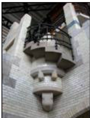
Detail van de trapopgang van perrongebouw D.