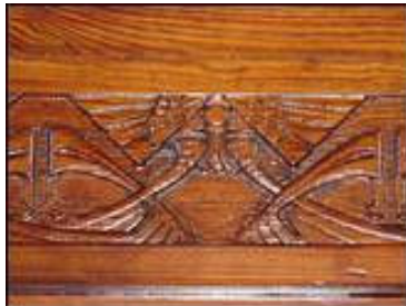
Houtsnijwerk in wachtkamer 1 e klasse

Post, W., "Jac. van den Bosch" in 'Ons Bloemendaal', 25 e jg, nr. 2, zomer 200;