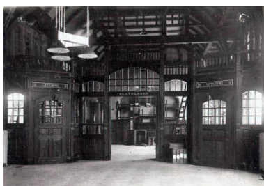
Wachtkamer/Restauratie 1 e /2 e klasse bij oplevering in 1906.