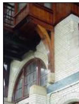
Detail van de erker van de seinkamer op het perrongebouw D.

Tegeltableau van 180 x 140 cm in perrongebouw E boven de toegangen naar de voormalige wachtkamers 1 e klasse. Ook in dit sprekende paneel verbeeldt de zwaluw aan de onderzijde van de beide stootblokken de trein, net als in de andere tegeltableaus. Het tableau met zijn krachtige lijnen en verfijnde kleurschakeringen mag, binnen de fraaie zandstenen omlijsting waarin het is gevat, gerust als een meesterwerk worden opgevat.