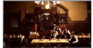
Wachtkamer/Restauratie 1 e / 2 e klasse (reclamefoto).