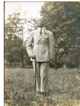
Willem van Konijnenburg, 1926

ment onder zijn kunst te leggen. Rolmodellen waren niet langer succesvolle tijdgenoten als Willem Maris en Hendrik Willem Mesdag, maar renaissancekunstenaars als Michelangelo en Leonardo da Vinci. In zijn geschriften zette hij een gedetailleerd systeem van regels uiteen aan de hand waarvan absolute schoonheid tot uitdrukking gebracht kon worden. In zijn kunst demonstreerde hij de toepassing van die regels. Het opbouwen van de compositie op basis van symmetrie vanuit een mathematisch grondpatroon was het meest in