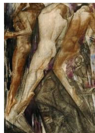
De dans van het noodlot, 1918, krijt op papier, 120x88, E.G. Martens, Den Dolder

perspectief, dan kan men hem moeilijk anders zien dan als een van de vele nalopers. Beziet men hem vanuit classicistisch perspectief, dan behoort hij tot de voorlopers van de retour à l'ordre die tijdens en na de Eerste Wereldoorlog plaatsvindt. Maar van welk perspectief ook bekeken: ik heb duidelijk willen maken dat Van Konijnenburg met zijn doelstelling in zijn werk algemene waarden tot uitdrukking te brengen, zijn idealistische opvatting van geometrie als enige zuivere basis voor de compositie, zijn keuze zijn motieven te modelleren naar een renaissancistisch schoonheidsideaal en zijn wens zich te meten met de grootmeesters van de Europese schilderkunst een geheel eigen bijdrage heeft geleverd aan de moderne kunst in Nederland.