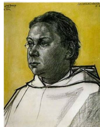
Jan Toorop, portret van Pater B.H. Molkenboer, tekening, 1914, collectie Drents Museum

* In het bovenste vakje vinden we de boog van de poort met de lauwertakken terug. Het is verder gevuld met de top van een symmetrisch gestileerde plant in goud, die in het derde vak oprijst. Tussen de uitlopers bevindt zich een klein wit kruisje in gouden aureool. * Het tweede vakje laat de titel zien, de vier hoeken opgevuld met gestileerde arabesken, en een Latijns wit kruis met een aureool rond het verbindingspunt. * Het derde vakje wordt in hoofdzaak gevuld met de in goud gestileerde plant. In het midden tussen de takken een wit Grieks kruis, gevat in een gouden aureool; in het bovenste deel een klein wit kruisje als vulling van de leegte. * Het vierde vakje vermeldt de naam van de schrijver. * Het vijfde is de basis met tussen twee gouden lijnen gevatte bolletjes, die verwantschap vertonen met een gotische eierrand, van onder afgesloten met lauwertakken. * Het zesde en onderste vakje vermeldt de naam van de uitgever.