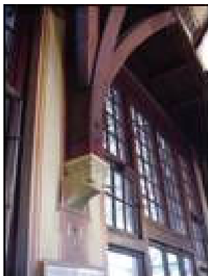
Detail kapspantconsole in Wachtkamer 3 e klasse.