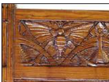
Houtsnijwerk in wachtkamer 1 e klasse.

Tijdens de open dag vanwege het eeuwfeest van station Haarlem op 30 augustus jl. hebben ongeveer 15.000 bezoekers het stationscomplex bezocht. Daarmee werd weer duidelijk dat veel mensen 'iets' hebben met dit stationscomplex, dat in de periode 1903-1905 werd vormgegeven in een consequente lijnvoering volgens de stijlstroming van de Nieuwe Kunst. De stijkenmerken zijn terug te vinden van de details tot de grote lijn in dit totaalkunstwerk.