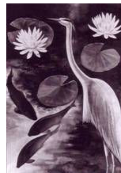
Reiger met waterlelies , 1940 penseel, Oost-Indische inkt en sepia, 65 x 46,5 cm

Essers' vrije oeuvre bestaat voor het grootste deel uit landschappen, waarvan verschillende met een symbolische voorstelling of een symbolische inhoud. Hij werd niet beïnvloed door de avant-garde van zijn tijd of door zijn artistieke omgeving. Van zijn neef de schilder Henri ten Holt, die tot De Nieuwe Kring behoorde, zei hij eens: 'Als ik met hem praat ben ik altijd mijlen van hem weg. [...] Ernstig plechtig en ernstig gezwam.'