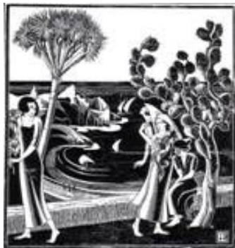
't Haantje - ook bekend als De cactusboom - [1921] houtsnede, 55 x 53,5 cm

Bernard Essers werd geboren in Kraksaan op Java in Nederlands-Indië. Zijn vader was daar gouvernementsarts, zijn moeder was onderwijzeres. Hij kreeg zijn belangrijkste artistieke vorming op het Royal College of Art in Londen (1910-1911). Daarna specialiseerde hij zich in grafiek bij Graadt van Roggen en Veldheer. Aanvankelijk maakte Essers vooral houtgravures en houtsneden voor illustraties, onder andere voor boeken van Arthur van Schendel ( Een zwerver verliefd , De Berg van dromen , Safija en Een zwerver verdwaald ), van Adriaan Roland Holst ( Deirdre en de zonen van Usnach ) en bij Beatrijs van P.C. Boutens. Ook ontwierp hij enkele omslagen voor het 'maandblad voor bouwen en sieren' Wendingen . Hij raakte bevriend met kunstenaars die tot de voortrekkers van de symbolistische kunst in Nederland hadden behoord, Jan Toorop en Richard Roland Holst; uit Essers' werken tot omstreeks 1925 blijkt hoe hij deze kunstenaars waardeerde. Nadat hij zich in 1920 in het kunstenaarsdorp Bergen had gevestigd maakte hij vrienden onder zijn collega's van de Bergense School en van De Nieuwe Kring.