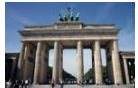
(Vervolg op pagina 2)