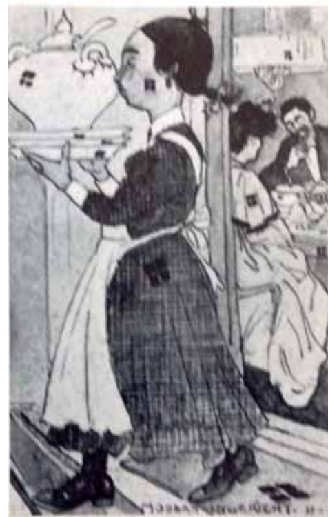
Afb. 3. Leo Gestel, Modern ingericht, spotprent, aquarel, 1907.

De ontwikkeling in de aardewerkindustrie had aanvankelijk geleid tot de overname van de kleine ambachtelijke aardewerkfabriekjes door fabrieken, in de jaren twintig was er een tendens waar te nemen dat grotere fabrieken kunstnijverheidsafdelingen oprichtten binnen het bedrijf. In dit kader nodigde Plateelbakkerij Zuid-Holland, bekend geworden door het succesvolle Goudse Plateel, (verworden tot een enigszins karakterloos product), Chris van der Hoef uit, om een nieuw decor te ontwerpen voor het meer dan twintig jaar oude Blokjesmodern en om enkele nieuwe