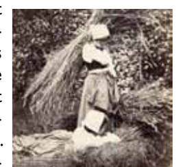
Anoniem (fotograaf), Adolphe Giraudon (uitgever), Twee boerinnen, voor 1878, Musée d'Orsay, Parijs.

Fotografie is niet meer weg te denken uit ons dagelijks leven, maar in de 19de eeuw was het een nieuw en bewerkelijk medium. Al snel na de uitvin-