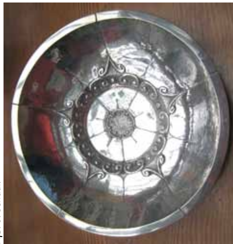
Afb. 8. Schaal.