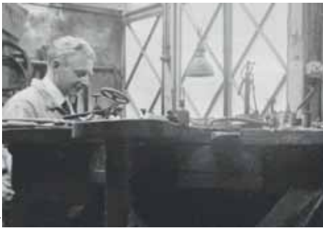
Afb. 5A. Atelier 1935-2.

Na de oorlog stopt hij vanwege een zenuwontsteking in zijn rechterarm met het smeden van zilver; de resterende jaren maakt hij nog slechts sieraden. Hierbij ontwikkelt hij in samenwerking met de essayeursbedrijven Drijfhout en Schöne te Amsterdam aan het begin van de jaren 1950 de mogelijkheid palladium als metaal voor juwelenfabricage te gebruiken. Ook gaat hij zich bezighouden met galvanotechniek en het elektrisch lassen van edelmetalen. In de jaren 1930 had hij naast een studie elektrotechniek aan de Sorbonne te Parijs gewerkt als technisch adviseur voor de bestekfabriek van de firma Wolfers te Brussel. De firma Wolfers was – zoals in de vorige aflevering beschreven - een oude zakenrelatie van de