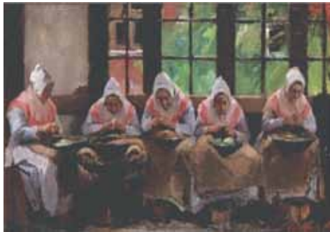
Afb. 6. 'Vijf aardappel-schillende bewoonsters van het Oudliedengesticht, Amsterdam', gesigneerd 'ED: Frankfort' (rechts onder), (z.j.), olieverf op doek, 35 x 48 cm.

Frankfort gedurende drie jaar (1885-1887) de Koninklijke Subsidie. In 1904 werd hij met de Koninklijke Gouden Medaille bekroond. Daarnaast exposeerde Eduard Frankfort herhaaldelijk met goed gevolg. In Nederland ontving hij diverse medailles op de 'Tentoonstelling van Levende Meesters' en zesmaal ontving hij een prijs voor ingezonden schilderijen op Wereldtentoonstellingen en andere internationale tentoonstellingen.