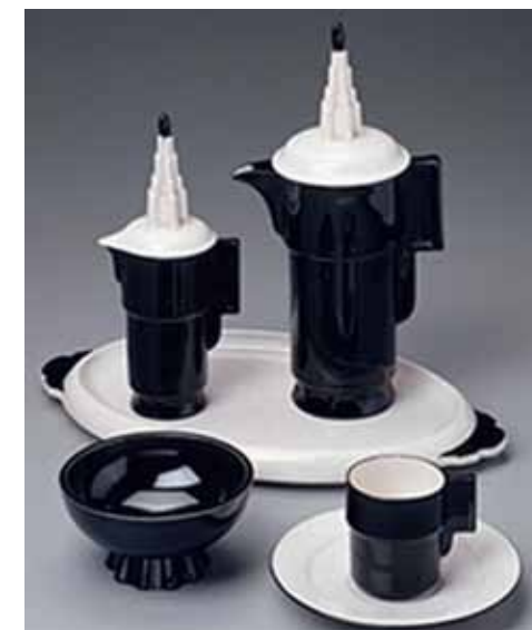
Afb. 5. Mokkastel, wit aardewerk met zwarte glazuur, uitv. Zuid-Holland, ca. 1927. Museum of fine Arts, Boston.

Tot slot. Servies 4300, is een zeer zeldzaam servies (zie Afb. 1). Die zeldzaamheid is wel verklaarbaar. De productiekosten van