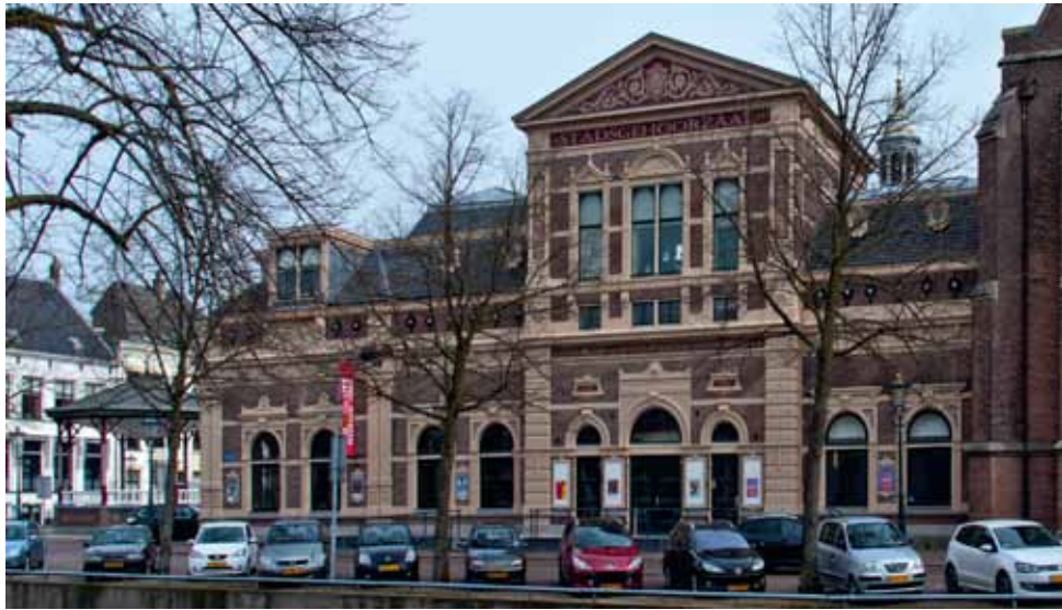
Stadsgehoorzaal te Kampen.

ceerd, waaronder keukenpannen. Het bijzondere aan Brunnepe is dat vrijwel de hele wijk door één architect is gebouwd: G.B. Broekema (1866-1946). Hoogtepunt van de Broekema-architectuur is het Begijnkwartier.