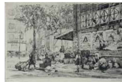
Afb. 3. Ets Les Halles.