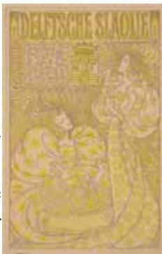
Toorop, Affiche Delftse slaolie.

beeldende kunst en wisten op hun beurt andere kunstenaars te inspireren. Zo was Toorop bijvoorbeeld een grote inspiratiebron voor Gustav Klimt.