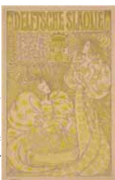
Toorop, Affiche Delftse slaolie.

beeldende kunst en wisten op hun beurt andere kunstenaars te inspireren. Zo was Toorop bijvoorbeeld een grote inspiratiebron voor Gustav Klimt.