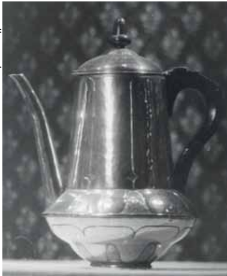
Afb. 7. Koffiekan.

ciseleertechniek, en maakt slechts unica (Afb. 6, 7, 8). In totaal zijn er ongeveer 1000 stuks zilver van zijn hand bekend: als zogeheten 'groot zilver' onder andere koffie en theeserviezen, kandelaars, (brood)schalen, bekers, bladen, koektrommels, sigarenkisten, als bestekwerk lepels, vorken, viscouverts, schepwerk, en als 'kleinwerk' servetbanden,