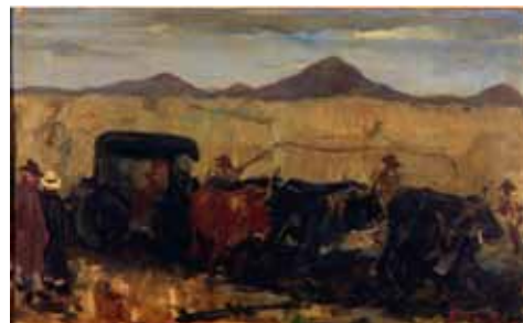
Afb. 7. 'De Trek, Zuid-Afrika', gesigneerd 'ED: Frankfort' (rechts onder), circa 1906, olieverf op doek, 72.5 x 97 cm.

een persoonlijke motivatie om Zuid-Afrika te bezoeken, en zette hij tegelijkertijd zijn schilderpraktijk hier onverminderd voort. Het land intrigeerde hem onmiskenbaar. In zijn Zuid-Afrikaanse schilderijen gaf hij vrijwel exclusief uitbeelding aan het inheemse landschap en de lokale bevolking. Eduard Frankfort was voornamelijk werkzaam en woonachtig in en rondom Pretoria. Halverwege 1906 assisteerde Frankfort in de organisatie van het 'Rembrandt Tricentenary Festival and Exhibition' en in december 1906 werd hem een solotentoonstelling aangeboden door 'twaalf invloedrijke Pretorianen' waarin 47 werken opgenomen waren.