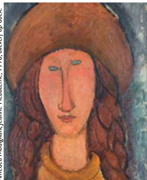
Amedeo Modigliani, Jeanne Hébuterne, 1918, olieverf op doek.

Singer Laren wisselt zijn collectie uit met musée d'Art moderne de Troyes in Frankrijk. Een museum dat net als Singer Laren zijn bestaan dankt aan een unieke particuliere kunstverzameling. Geïnspireerd door bevriende kunstenaars als Derain en Marinot,