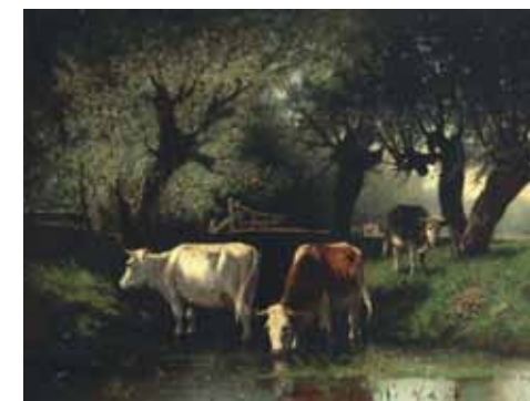
Hendrikus van Ingen, Koeien in de beek onder knotwilgen.

Als het dorp zich in de loop van de negentiende eeuw ontwikkelt tot een deftig villadorp wordt het voor de kunstenaars minder interessant. De aandacht verlegt zich dan ook aan het einde van deze eeuw naar het dan nog landelijke boerendorp Renkum en omgeving, waar in 1895 de kunstschilder