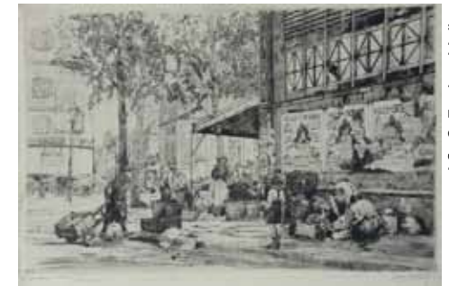
Afb. 3. Ets Les Halles.