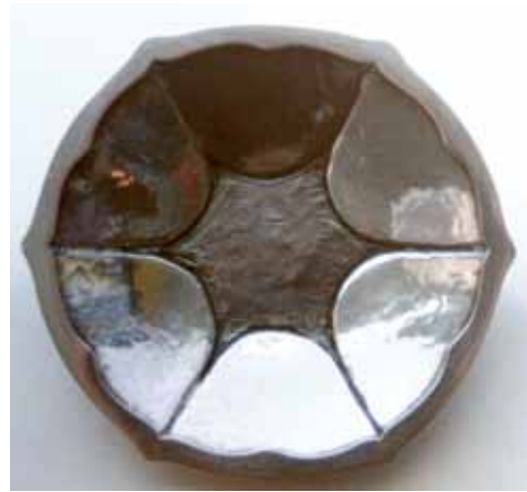
Afb. 6. bombbakje 1932.