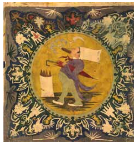
Cornelis Middelkoop, decoratief ontwerp van een sigarenrokende man in een cirkel met daaromheen een randversiering; guachel/waterverf op een ondertekening in potlood, papierformaat, 53,5 x 50 cm. Collectie Frans Walkate Archief.

onder het pseudoniem C.H.L. Pookleddim (anagram van Middelkoop) in twee schriften.