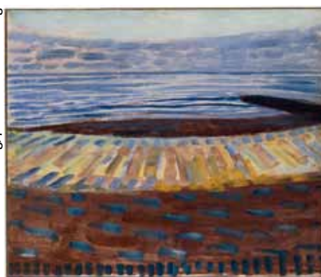
Piet Mondriaan, Zee na zonsondergang, 1909, olieverf op karton, Gemeentemuseum Den Haag, foto RKD Den Haag.

lang water uit de zee gehaald en deels laten verdampen. Ook heeft hij op die plek duizenden foto's gemaakt van het sublieme Zeeuwse licht. Hij heeft met zijn installatie historische gegevens met hedendaagse gecombineerd en biedt op geheel eigen wijze een nieuwe kijk op de kunsthistorie.