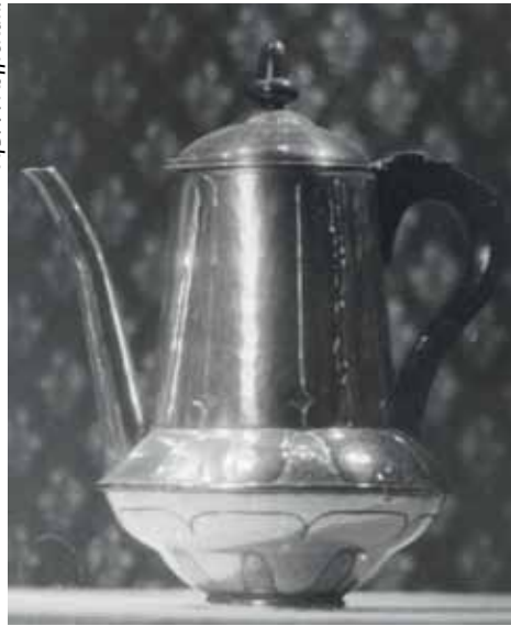
Afb. 7. Koffiekan.

ontwerpt en vervaardigt zilverwerk in een geheel eigen stijl, waarin hij Art Deco combineert met het kwabwerk van zeventiende-eeuwse edelsmeden als Johannes Lutma, de edelsmidfamilie Adam, Paulus en Christiaan van Vianen en Andries Grill. Zijn organische vormgeving heeft echter een strenge geometrische basis. Hij werkt uitsluitend in zilver van het eerste gehalte, met drijf- en