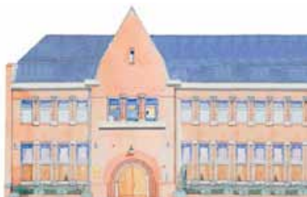
Ontwerp Nutsspaarbank te Kampen.