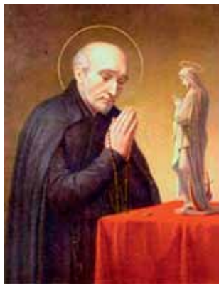
St. Alphonsus Rodriguez werd in 1888 heilig verklaard door paus Leo XIII.

Toorop maakte de jubileumprent voor het St. Alphonsuspatronaat in 1926, 2 jaar voor zijn overlijden op 3 maart 1928. Hiermee is het een van zijn laatste grafische ontwerpen.