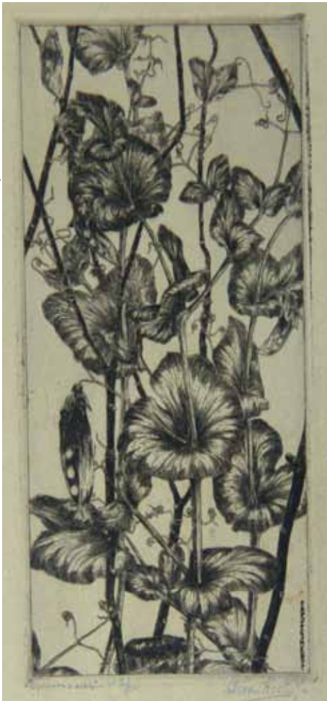
Afb. 4. Eis Oost-Indische Kers..