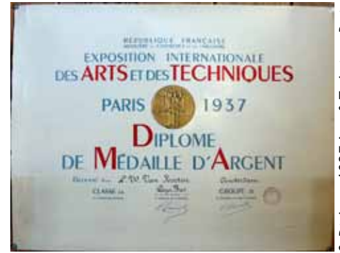
Afb. 9. Diploma 1937 Arts & Technique Paris.

pillendoosjes, wijnkurken, messenleggers, briefopeners, etc. Met zijn zilverwerk neemt hij deel aan de XVII Biennale te Venetië in 1930, en in 1937 aan de Exposition Internationale des Arts et Techniques dans la Vie Moderne te Parijs, waar hij een zilveren medaille behaalt (Afb.9). Maar ook ontwerpt hij in deze periode kristallen glazen, inktpotten en dergelijke. Daarnaast tekent hij vanaf 1939 en tijdens de Tweede Wereldoorlog een manuscript met Hollandse windmolens en een overzichtswerk over heraldiek (Afb. 10 / pag. 20).