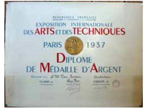
Afb. 9. Diploma 1937 Arts & Technique Paris.

ciseleertechniek, en maakt slechts unica (Afb. 6, 7, 8). In totaal zijn er ongeveer 1000 stuks zilver van zijn hand bekend: als zogeheten 'groot zilver' onder andere koffie en theeserviezen, kandelaars, (brood)schalen, bekers, bladen, koektrommels, sigarenkisten, als bestekwerk lepels, vorken, viscouverts, schepwerk, en als 'kleinwerk' servetbanden,