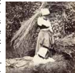
Anoniem (fotograaf), Adolphe Giraudon (uitgever), Twee boerinnen, voor 1878, Musée d'Orsay, Parijs.

Fotografie is niet meer weg te denken uit ons dagelijks leven, maar in de 19de eeuw was het een nieuw en bemerkelijk medium. Al snel na de uitvin-