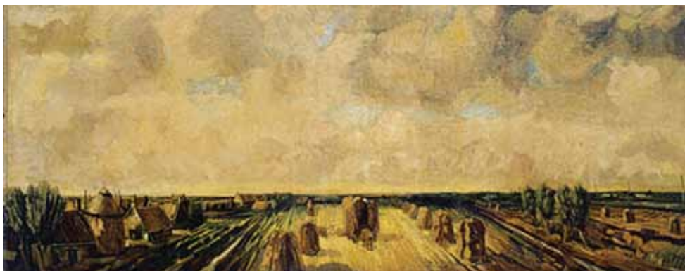
Henk Chabot, Polderlandschap (uitsnede), 1938.

De Kunsthal Rotterdam introduceert voor het eerst op het Europese vasteland een groot overzicht van Sir Stanley Spencer (1891-1959), een van de belangrijkste Britse schilders uit de twintigste eeuw. Zijn oeuvre kenmerkt zich door een rijkdom aan thema's zoals Bijbelse verhalen, landschappen, zelfportretten en huiselijke scènes. Door